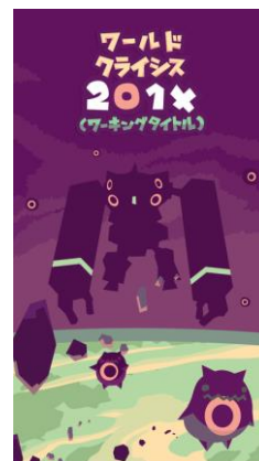
『ワールドクライシス 201X』 (ワーキングタイトル)

海賊の財宝をクレーンで引き上げる 滑らか操作が癖になる 新感覚クレーンアクションゲーム (共同開発: KEYROUTE)