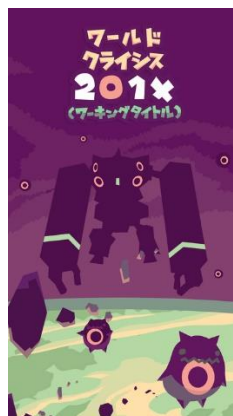
『ワールドクライシス 201X』

海賊の財宝をクレーンで引き上げる 滑らか操作が癖になる 新感覚クレーンアクションゲーム (共同開発: KEYROUTE)