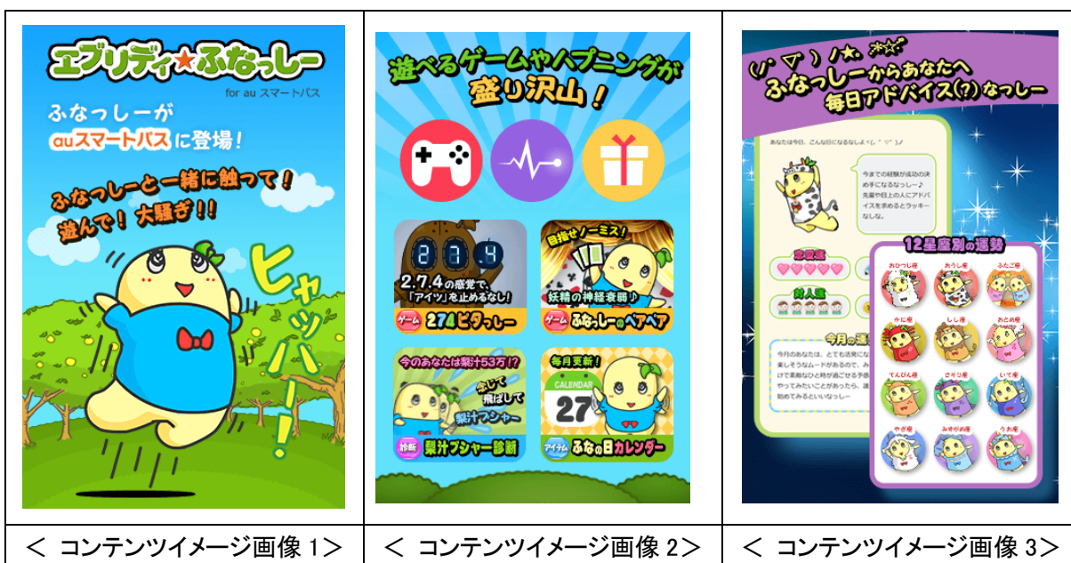
< コンテンツイメージ画像 1 >