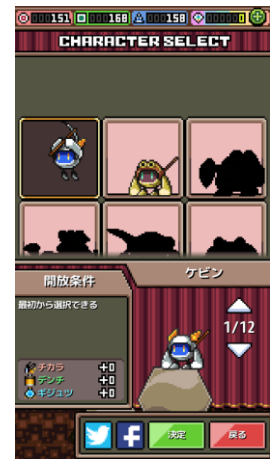
ゲームをたくさん遊ぶと、個性豊かなキャラがゲットできる！

『PICK-XELL』は、画面の左右をプチプチとタップするだけのシンプル操作で、地中深くに穴を掘り進めることを目指すゲームです。ユーザーは「ジェム」と呼ばれるお宝をゲットしながら、穴掘りの邪魔をする「ドクロ」を回避し、各ステージのミッションクリアを目指します。何処までも掘り進められるエンドレスモードも選択でき、世界中のユーザーとスコアを競うことも可能です。ドット画や8bitのサウンドなどレトロゲームの雰囲気をまとった、年末年始の空き時間にゆるく“やりこめる”カジュアルゲームです。