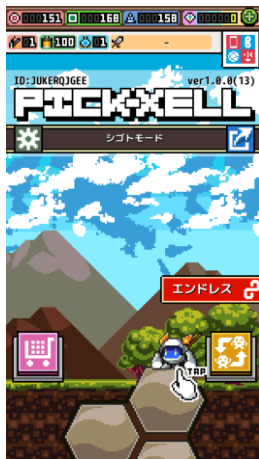
メインタイトル画面。 可愛いキャラをゲットし掘り進め！

株式会社メディア工房(本社:東京都港区、代表取締役社長:長沢一男)が手掛ける、ゲームブランド OBOKAIDEM( http://www.obokaidem.com )は、新感覚！プチプチ系採掘アクションゲーム『PICK-XELL』(ピックスル)を、AppStore・Google Playを通じ、12月10日(木)より世界140ヶ国、11言語(日本語/英語/スペイン語/中国語(簡繁)/韓国語/ポルトガル語/フランス語/ドイツ語/ロシア語/タイ語)対応で全世界へ配信しました。