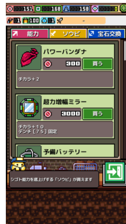
集めたジェムを使って装備購入。パワーアップしてクリアを目指す。